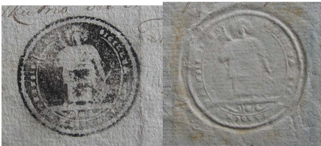
Pieczęć parafii pod wezwaniem św. Wawrzyńca w Kutnie z 1810 r. (odciski wykonane w tuszu i przez papier) APK, Akta Sądu Pokoju w Kutnie, sygn. 20

W trakcie przeprowadzonej wówczas kwerendy nie odnaleziono jednak żadnego odcisku tej pieczęci i dlatego zapewne burmistrz Klepa błędnie stwierdził, iż pieczęć z wyobrażeniem św. Wawrzyńca była wyłącznie pieczęcią parafii kutnowskiej.