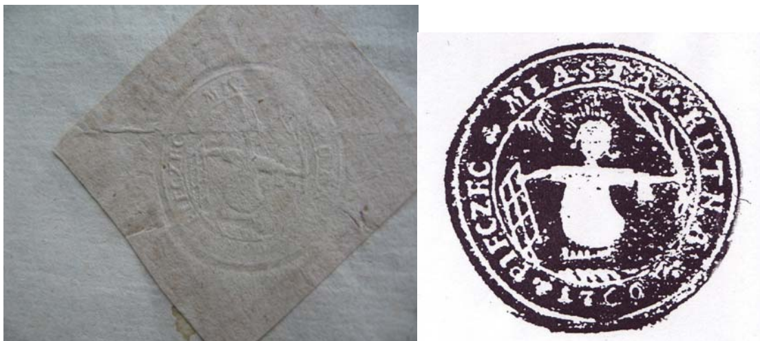
Staropolskie pieczęcie miejskie (odciski przez papier i w tuszu)

Po drugim rozbiórce Polski, na terenach zajętych przez Prusy nie zaprzestano używania herbowych pieczęci miejskich. Władze pruskie nie zabraniały ich stosowania, a wcześniejsze tradycje herbowe wykorzystywały przystosowujące je do swoich potrzeb: około 1793r. miało powstać rozporządzenie, na mocy którego pieczęcie miast powinny zawierać oprócz swego herbu także godło pruskie 7 . Jak świadczą przytoczone wyżej przykłady, władze Kutna nie od razu zastosowały się do owego rozporządzenia.