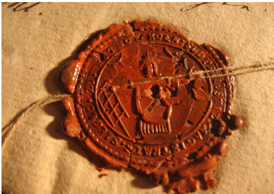
Pieczęć magistratu Kutna, przełom XVIII/XIXw. (APK, Hipoteka w Kutnie, sygn. 2519)