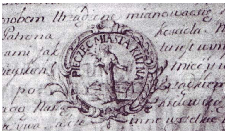
Wzór pieczęci miejskiej z przywileju lokacyjnego z 1766 roku

W tekst dokumentu wrysowany został wzór tej pieczęci. Przedstawia on postać męczennika z liściem palmowym w prawej dłoni, jako symbolem zwycięstwa. W tle za postacią znajduje się krata – miejsce kaźni św. Wawrzyńca, umęczonego na rozpalonych ogniach. Całość opleciona jest ozdobnym wieńcem. Na polu pieczętnym ulokowany został napis: PIECZĘĆ MIASTA KUTNA.