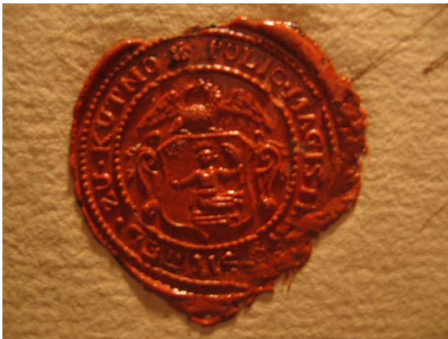
Pieczęć magistratu kutnowskiego z czasów pruskich (APK, Akta miasta Kutna sygn. 16)

Początek treści napisu zaznaczony jest rozetką w kształcie kwiatu o pięciu płatkach.